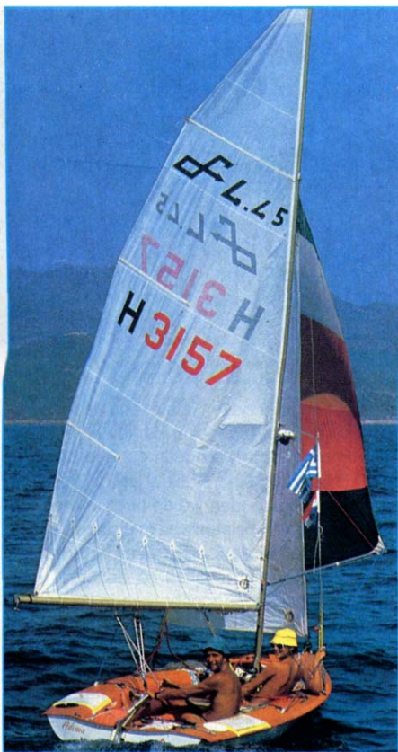
De Naima: een open zeilboot, type Simoun 4.45.

Eenmaal de baai uitgekruist en de eerste kleine kaap gerond, ging de spinnaker omhoog. Een bestemming hadden we niet; we zagen wel hoever we zouden komen. Want één ding hadden we op onze vorige reis (langs de Joegoslavische kust) wel geleerd: het heeft geen zin om met alle geweld een bepaalde plaats te willen bereiken. Ten eerste mis je dan misschien