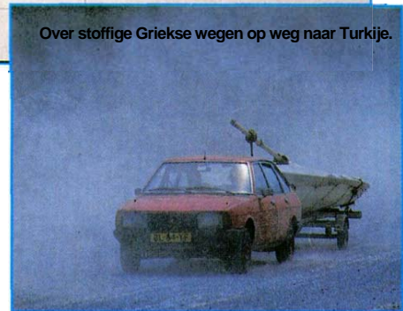
Over stoffige Griekse wegen op weg naar Turkije.