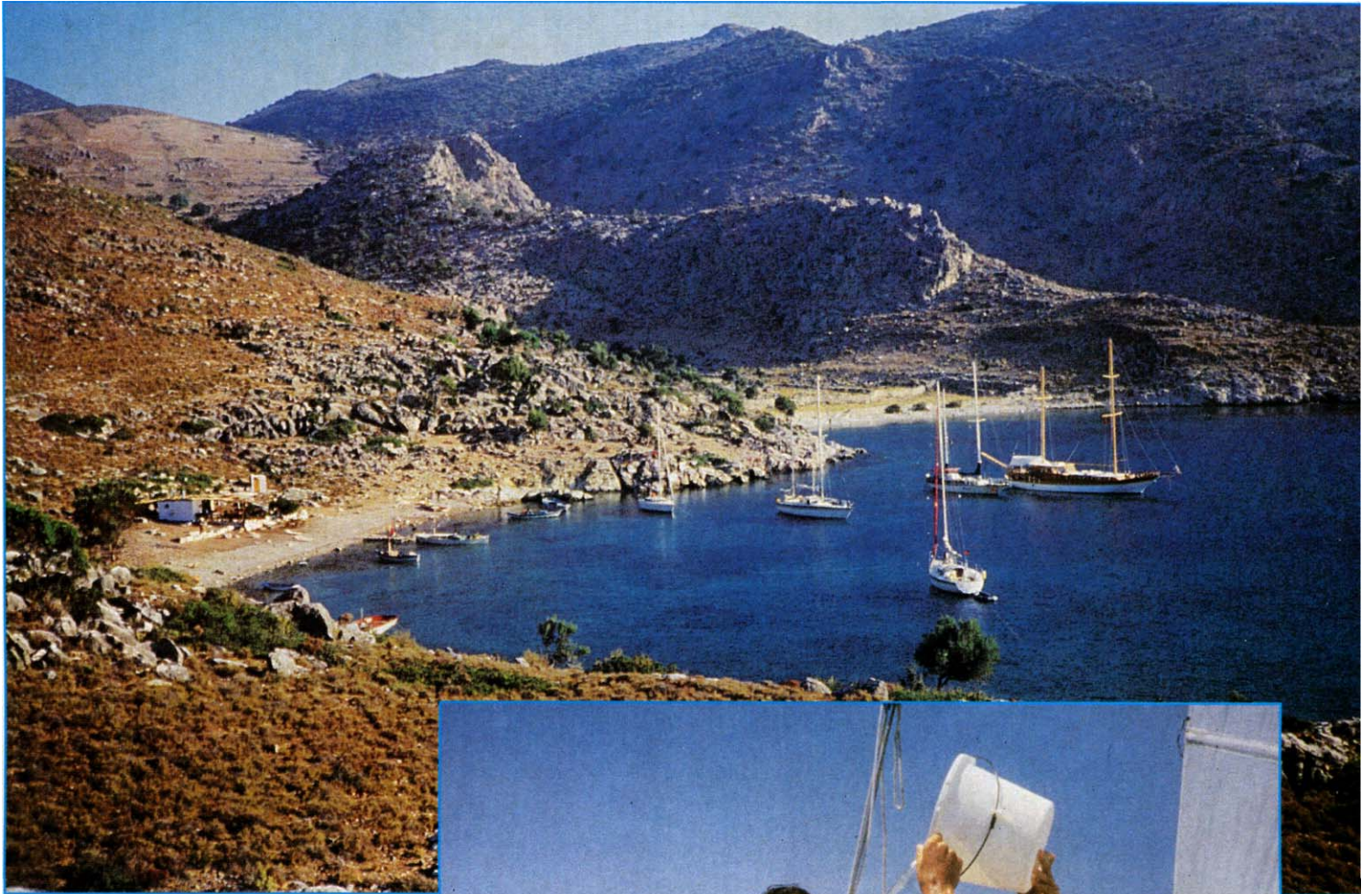
Boven: in de baai van Bozukale. Rechts: de verzen- gende zon en de urenlange windstiltes vergen alles van je conditie. De enige remedie is je nat houden.

De baai lag beschut achter een kale heuvelrug en we zagen wat huizen. We voeren naar binnen en tot onze stomme verbazing stortte de wind zich nu van de heuvels en hadden we er alsnog moeite mee heelhuids een strandje aan de hoge kant te bereiken. Vandaar zagen we met de zeeijkker een haventje. We hezen opnieuw de zeilen en voeren erheen. Er was een klein dorpje. We oriënteerden ons en zagen een mooi strandje aan lagerwal waar we de Naima over een rand van zeewier de kant op trokken. Ideaal, een zwaardboot. Van een Franse solozeiler, Benoit, die tegelijk met ons was binnengelopen, hoorden we dat er die ochtend om zeven uur al kracht vier had gestaan en dat als de Meltem 's nachts niet gaat liggen en 's ochtends nog steeds blaast dat hij dan echt hard gaat worden. De Naima lag vlak naast een oude windmolen, een van de weinige langs de Turkse kust. Deze baai was dus al eeuwen een bekende windhoek.