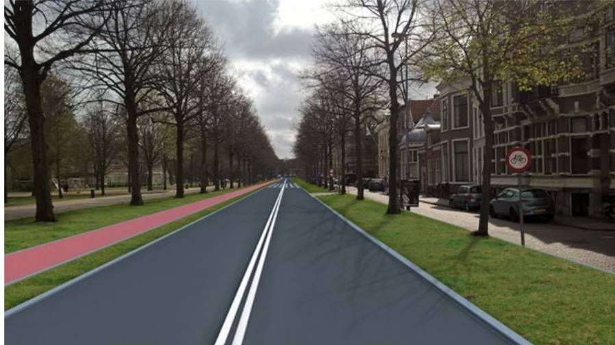
Zicht over de Dreef vanaf Houtplein. Voorstel gemeente, verlies van historie. (Afb. 2.)