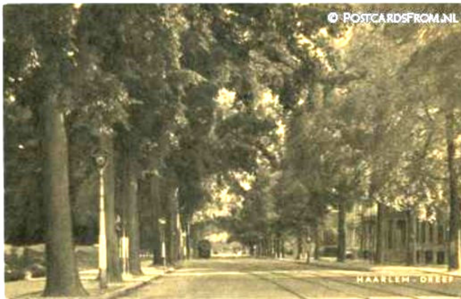
Zicht over de Dreef vanaf Houtplein. (afb. 1.)